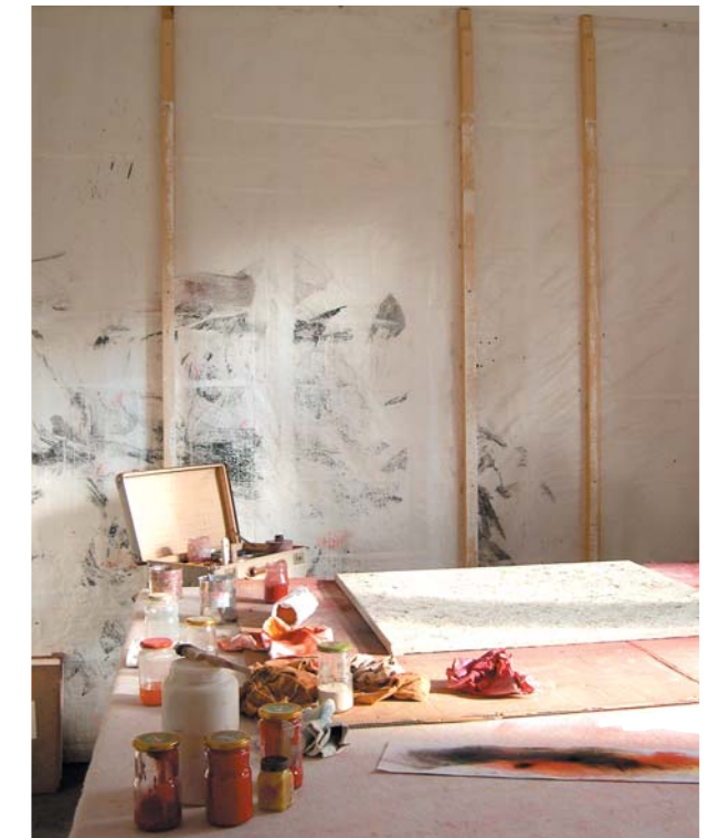
Norbert Simon/hier und jetzt