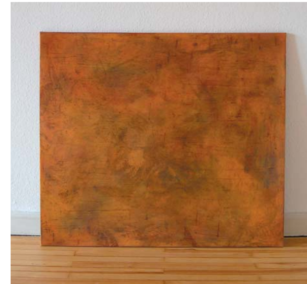
Ohne Titel Asche, Dispersion, Pigment, Malmittel auf Jute 105 x 120 cm, 2003